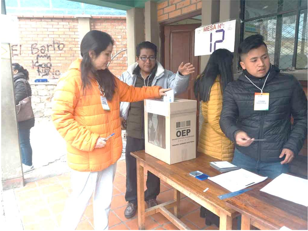
صورة تظهر صناديق اقتراع بوليفيا مما يبرز التنظيم اللوجستي للعملية الانتخابية