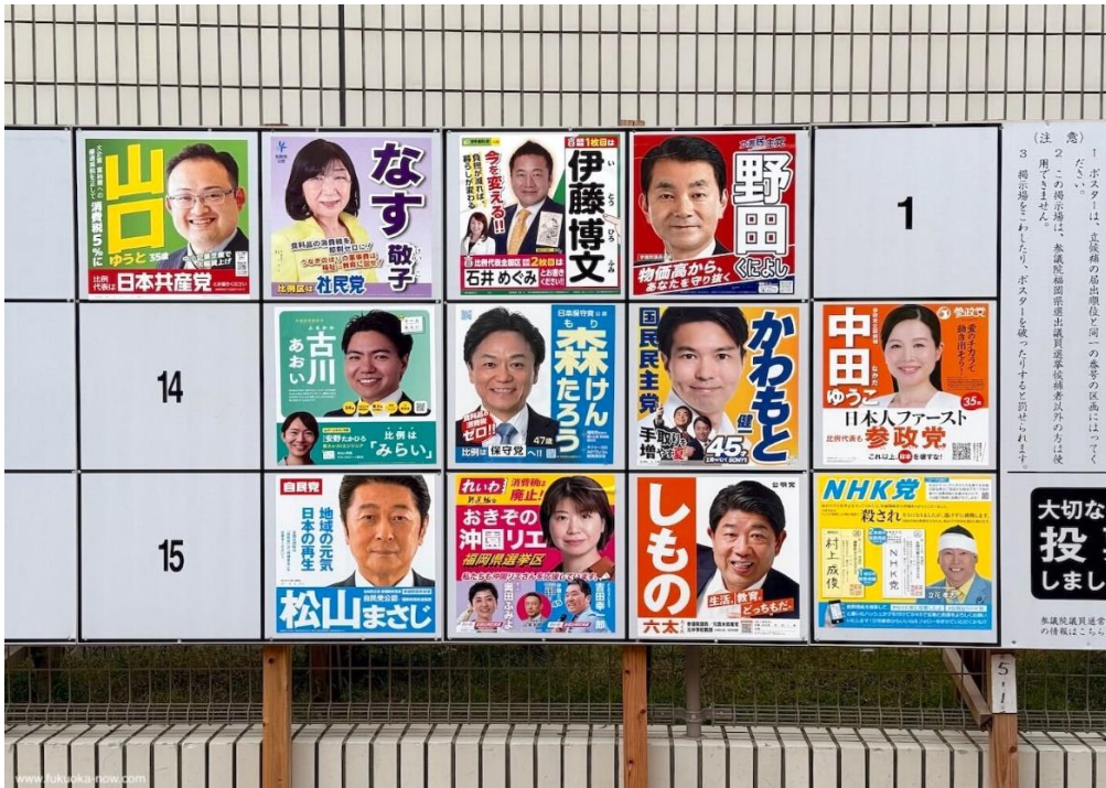
لافتات دعائية للمرشحين في دائرة انتخابية (فوكوكا)