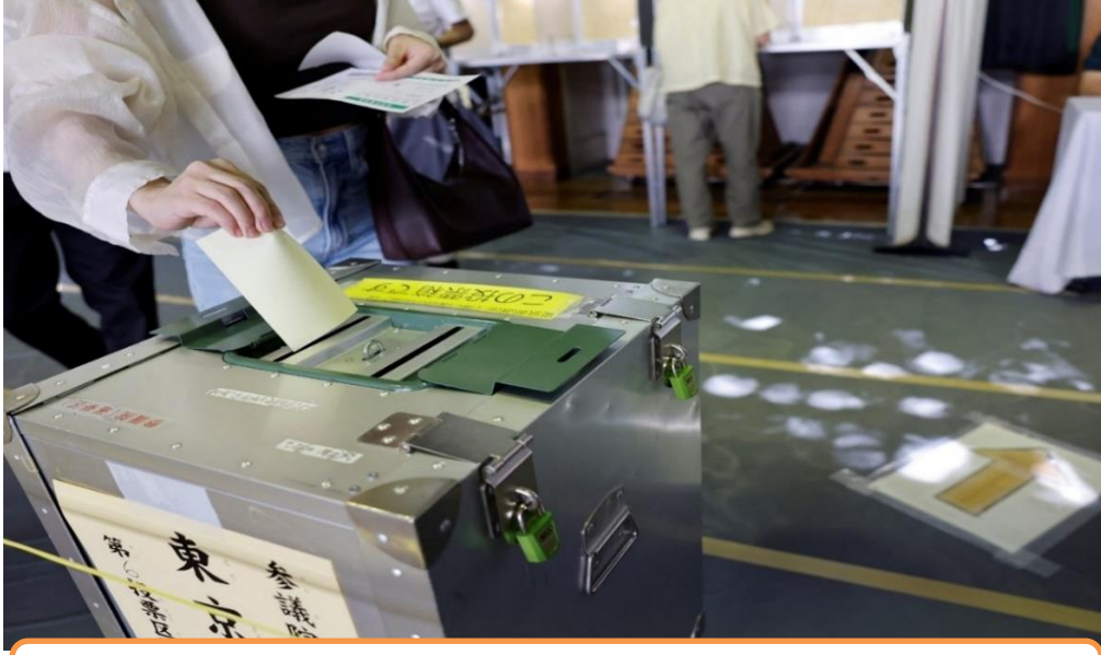
شخص يدلي بصوته في صندوق الاقتراع.