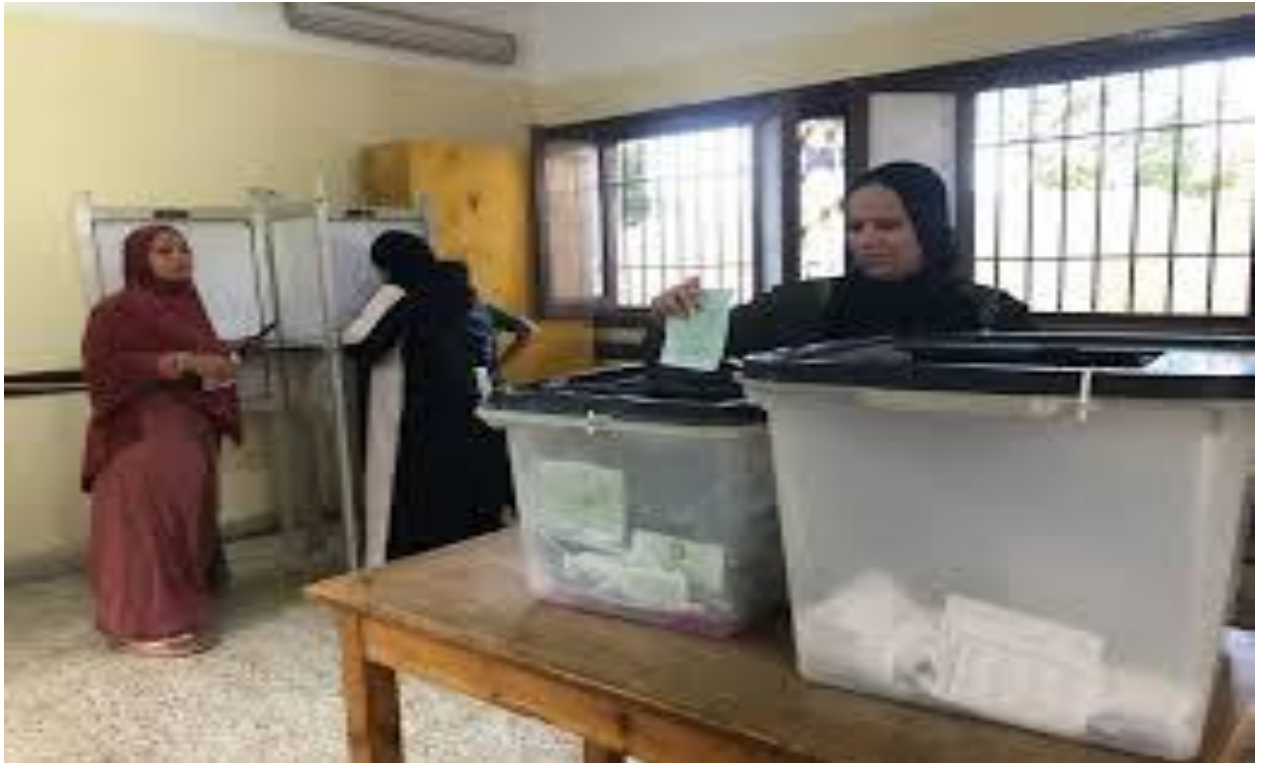
ناخبات يدلين بأصواتهنّ في أحد مراكز الاقتراع