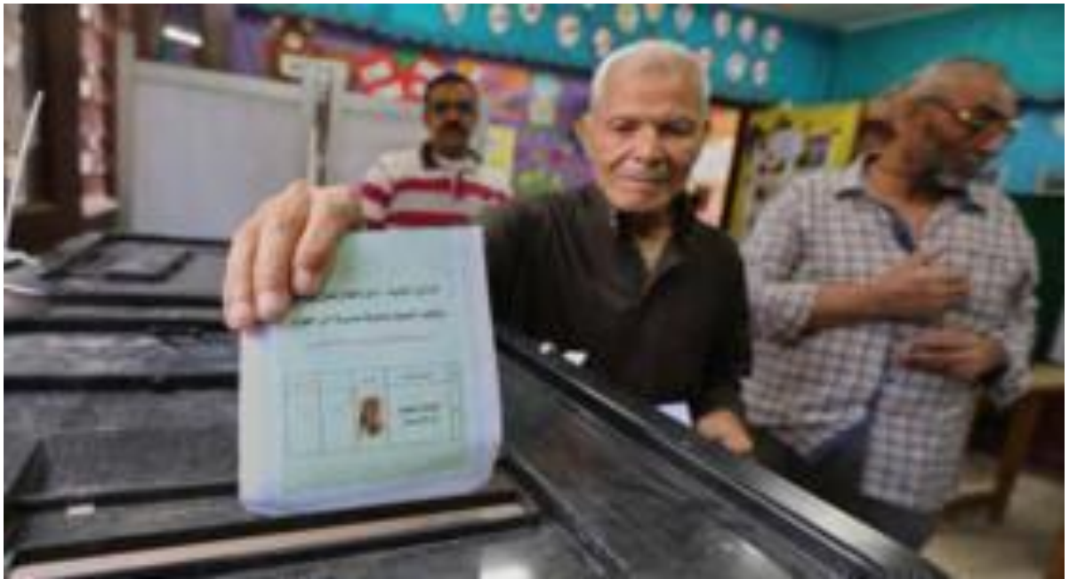
ناخب يضع بطاقة الاقتراع في صندوق الاقتراع