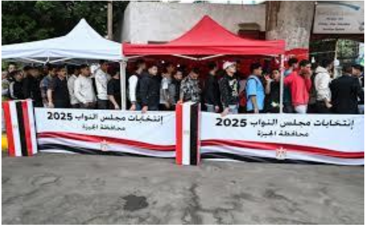
مجموعة من الناخبين ينتظرون دورهم في التصويت في إحدى الدوائر