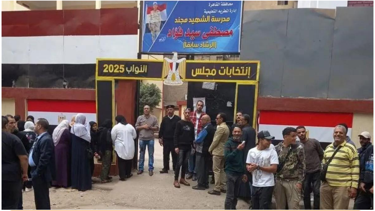
مجموعة من الناخبين أمام مركز اقتراع لانتظار دورهم في التصويت