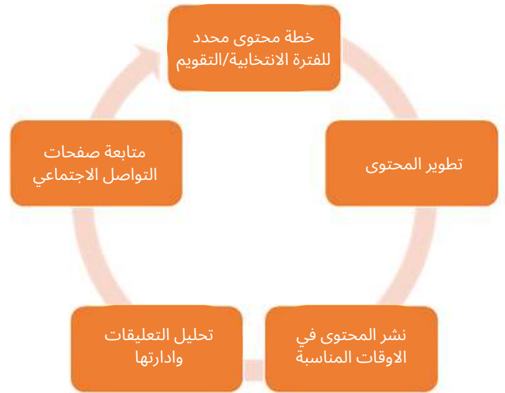
الشكل 10: أنشطة وسائل الإعلام الاجتماعية للمفوضية العليا المستقلة للانتخابات على النحو الذي اقترحه مكتب المساعدة الانتخابية لبعثة الأمم المتحدة لمساعدة العراق

وبدعم تقني واستشاري من بعثة الأمم المتحدة لمساعدة العراق ، أطلقت المفوضية العليا المستقلة للانتخابات مبادرات مشاركة رقمية جديدة لتعزيز التواصل ثنائي الاتجاه مع الجمهور من خلال منصات الإنترنت. لم تسمح هذه الجهود للمفوضية بنشر المحتوى فحسب، بل مكنتها أيضًا من الاستماع الفعال إلى الناس والتفاعل معهم. ساعد التفاعل الناتج على فهم مخاوف الجمهور وأسئلتهم واحتياجاتهم بشكل أفضل وسمح للمفوضية بإنشاء محتوى أكثر صلة وملاءمة استجابة لذلك.