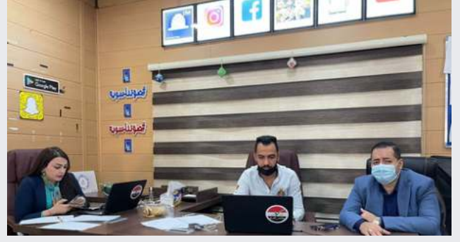
الشكل 14: عقد المفوضية العليا المستقلة للانتخابات جلسة أسئلة وأجوبة مباشرة

• من خلال مساهمة مكتب المساعدة الانتخابية، أدخلت المفوضية "نظام تصفية الكلمات" على وسائل التواصل الاجتماعي الخاصة بالمفوضية العليا المستقلة للانتخابات، وخاصة على منصة فيسبوك لمنع الأشخاص من نشر الكلمات المتعلقة بخطاب الكراهية والتعليقات المبتذلة والترويج للعنف. تم حذف التعليقات على منصات التواصل الاجتماعي الخاصة بالمفوضية العليا المستقلة للانتخابات وخاصة الفيسبوك التي تحتوي على عناصر خطاب الكراهية والكلمات التحريضية وغير اللائقة تلقائياً للحفاظ على منشورات وسائل التواصل الاجتماعي الخاصة بالمفوضية نظيفة. تم حذف المئات من التعليقات غير اللائقة والمبتذلة ضد المرشحين (بما في ذلك المرشحات والقادة من النساء) تلقائياً. التعليقات على صفحات وسائل التواصل الاجتماعي التابعة للمفوضية العليا المستقلة للانتخابات والتي تحتوي على مثل هذه الكلمات تم إخفاؤها تلقائياً. في المتوسط ، تمت تصفية وإخفاء 20-30% من التعليقات التي استخدمت "مثل هذه الكلمات" بواسطة صفحات وسائل التواصل الاجتماعي الخاصة بالمفوضية العليا المستقلة للانتخابات.