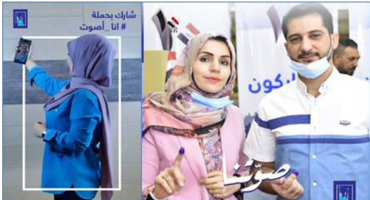
الشكل 11: حملة #انا - اصوت التي أطلقتها المفوضية العليا المستقلة للانتخابات بدعم من مكتب المساعدة الانتخابية

في يوم الانتخابات غيرت المفوضية حملتها من #انا - اصوت إلى #صوتنا ، وطلبت من الأشخاص مشاركة صورهم بأصابعهم التي عليها علامات الحبر بعد التصويت. تلقت هذه الحملة ردود فعل إيجابية للغاية من الجمهور حيث شارك مئات الأشخاص صورهم. ثم نُشرت هذه الصور على مواقع التواصل الاجتماعي الخاصة بالمفوضية العليا المستقلة للانتخابات. بعد يوم الانتخابات تم تغيير حملة #صوتنا إلى #صوتك - مسؤوليتنا، مما يؤكد للجمهور أن تصويتهم آمن وأن العملية بعد التصويت سيتم التعامل معها على قدم المساواة.