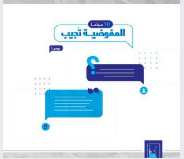
الشكل 15: إعلان عن جلسة سؤال وجواب مباشر على فيسبوك