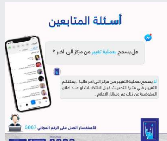
الشكل 19: محتوى وسائل التواصل الاجتماعية للمفوضية العليا المستقلة للانتخابات "سؤالك: إجابتنا"

• تدابير الأمن السيبراني: الانتخابات في العصر الرقمي عرضة للقرصنة وغيرها من أشكال التدخل الانتخابي. قدمت بعثة الأمم المتحدة لمساعدة العراق المساعدة إلى المفوضية العليا المستقلة للانتخابات في حماية بيانات وسائل التواصل الاجتماعي والحماية من الهجمات الإلكترونية. في عدة مناسبات ، تمت استعادة قنوات الوسائط الاجتماعية المخترقة (YouTube) من خلال اتصالات بعثة الأمم المتحدة لمساعدة العراق (يونامي) المباشرة مع مكتب المساعدة في YouTube. • مع مساهمة مكتب المساعدة الانتخابية، أطلقت المفوضية العليا المستقلة للانتخابات عدة حملات مثل "سؤالك: إجابتنا" لمعالجة الأسئلة الأكثر شيوعًا على وسائل التواصل الاجتماعي الخاصة بها. كانت هذه الحملات فعالة في توضيح التشوش وتبديد التضليل بين الناخبين.