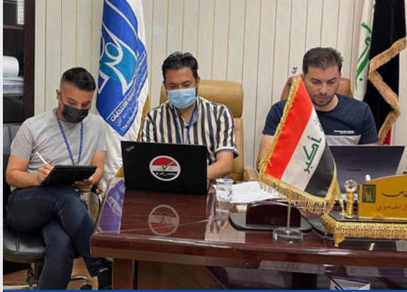
الشكل 17: عقد مستشارو مكتب المساعدة الانتخابية و المفوضية العليا المستقلة للانتخابات اجتماعًا مع شركة فيسبوك.

• تفاعلات منتظمة مع Meta / Facebook: بدعم من مكتب المساعدة الانتخابية ولجنة الإعلام والاتصالات العليا (CMC) ، أقامت المفوضية العليا المستقلة للانتخابات علاقة عمل مثمرة مع كبرى شركات التواصل الاجتماعية مثل ميتا / فيسبوك. تضمنت هذه العلاقة اجتماعات منتظمة مع مكتب فيسبوك الإقليمي لمنطقة الشرق الأوسط وشمال إفريقيا ، تم خلالها تقديم التوجيه والدعم التقني. وتناولت هذه الاجتماعات أيضًا ما يتعلق بإساءة الاستخدام المحتملة للمنصات خلال الفترة الانتخابية. كان هذا التعاون مفيدًا في إزالة المنشورات التي تنشر أخبارًا مزيفة وتنتهك قوانين الانتخابات ، وغالبًا ما استجابت شركة فيسبوك لطلبات المفوضية العليا المستقلة للانتخابات لإزالة الملفات الشخصية والمنشورات غير الدقيقة.