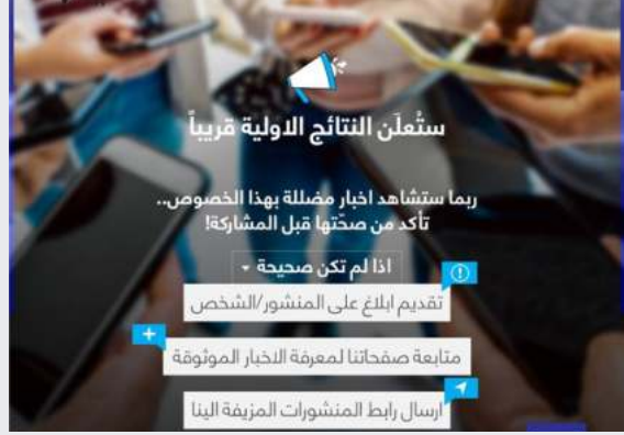
الشكل 18: محتوى المفوضية يشجع الناس على الاشتراك في المعلومات الرسمية للمفوضية

التعاون مع المجتمع المدني: من خلال مشروع "دعم العملية الانتخابية في العراق" التابع لبرنامج الأمم المتحدة الإنمائي ، قدم مكتب المساعدة الانتخابية التابع لبعثة الأمم المتحدة لمساعدة العراق منحة منخفضة القيمة إلى 31 منظمة من منظمات المجتمع المدني لدعم أنشطة توعية وتثقيف الناخبين. من 23 حزيران 2021 إلى 9 تشرين الاول 2021 ، نفذت منظمات المجتمع المدني هذه ما مجموعه 47 مشروعًا في جميع أنحاء البلاد. قامت منظمات المجتمع المدني بأنشطة توعية مختلفة باستخدام الوسائط الرقمية والاجتماعية.