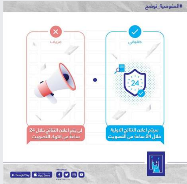
الشكل 16: محتوى التحقق من صحة النتائج النهائية للمفوضية العليا المستقلة للانتخابات