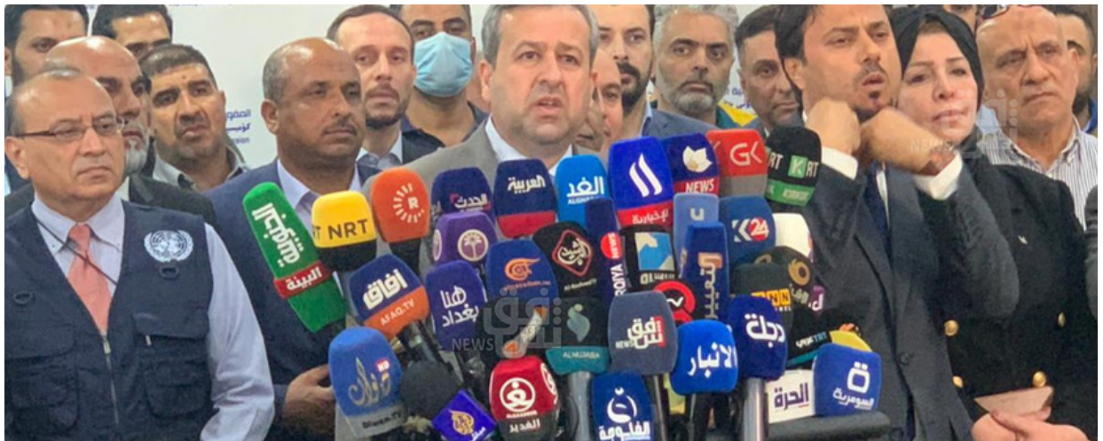
الشكل 3: إعلان رئيس مجلس المفوضين للمفوضية العليا المستقلة للانتخابات ومدير مكتب المساعدة الانتخابية الدكتور امير آرين النتائج النهائية

الغرض من هذا التقرير هو توثيق جهود المفوضية العليا المستقلة للانتخابات بدعم من مكتب المساعدة الانتخابية التابع لبعثة الأمم المتحدة لمساعدة العراق (يونامي) لمكافحة المعلومات الكاذبة والمعلومات المضللة خلال انتخابات مجلس النواب لعام 2021 وتقييم تأثيرها على دقة المعلومات التي يتم مشاركتها أثناء الانتخابات. كما يقدم التقرير لمحة عامة عن طبيعة وتأثير المعلومات المضللة في الانتخابات، ويفصل التدابير المحددة التي اتخذتها المفوضية العليا المستقلة للانتخابات لمعالجة هذه القضايا، ويعرض نتائج وتأثير هذه الجهود، ويقدم توصيات للجهود المستقبلية.