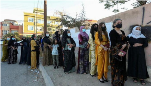
الشكل 7: الناخبات يصطفن في طوابير للتصويت في يوم التصويت

يعد السكان الشباب في العراق جزءا مهما وديناميكيا من المشهد الديموغرافي للبلاد حيث يوجد حاليا ما يقرب من 60% من سكان العراق دون سن 25 عاما، وقد لعب استخدام وسائل التواصل الاجتماعي دورا مهما في تمكين الشباب من التواصل والمشاركة والتنظيم لأسباب اجتماعية واقتصادية مختلفة. من المرجح أن يستمر هذا على ما هو عليه مع استمرار نمو وتطور الشباب، ومع استمرار تطور وسائل التواصل الاجتماعي وتلعب دورا متزايدا الأهمية في المجتمع العراقي.