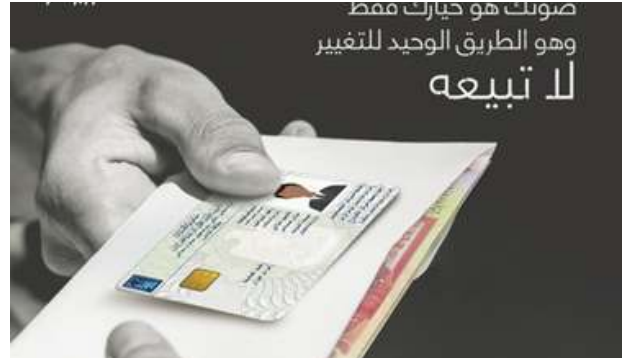
الشكل 2: محتوى المفوضية العليا المستقلة للانتخابات ضد الاحتيال والفساد

أحد الاتجاهات الملحوظة في استخدام وسائل التواصل الاجتماعي في العراق هو زيادة وجود الناشطين على الإنترنت. على سبيل المثال، لعب الاستخدام الواسع لوسائل التواصل الاجتماعي دورا رئيسيا في الاحتجاجات التي اجتاحت العراق في عام 2019، حيث استخدم العديد من العراقيين منصات مثل Facebook و Twitter لتنسيق وتبادل المعلومات حول التظاهرات التي أدت إلى تغيير قانون الانتخابات والمفوضية العليا المستقلة للانتخابات. وفرت وسائل التواصل الاجتماعي منصة جديدة وفرصة لجميع أصحاب المصلحة الانتخابيين للوصول مباشرة إلى الناس والتفاعل معهم.